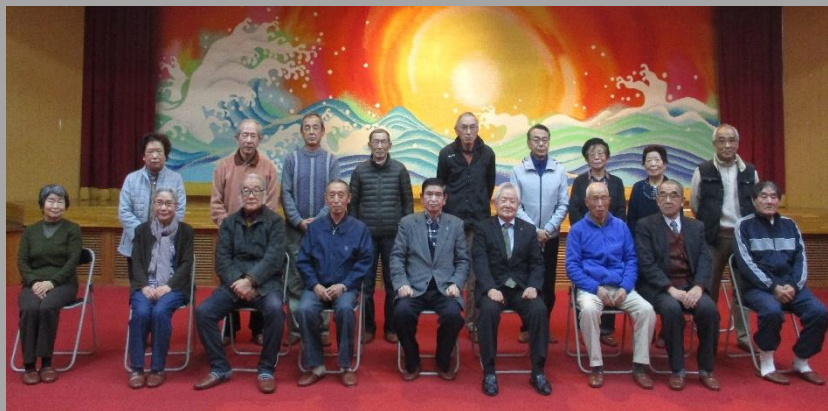
受講者による集合写真

どの講座も大変好評で年々参加者も増え、人気の出雲崎総合大学は、来年度もより一層の内容の充実を図り、様々な企画をいたしますので、皆さまのご参加をお待ちしています。