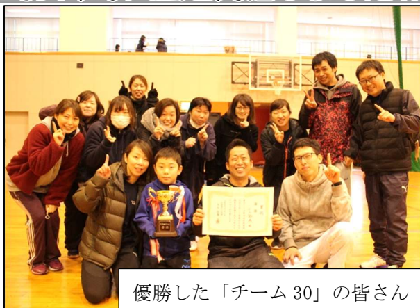
優勝した「チーム30」の皆さん

12月8日(日)に「第4回町民卓球大会」を開催しました。今年は17チーム約85名の参加となり、優勝を狙う参加者のやる気で会場は熱気に包まれました。