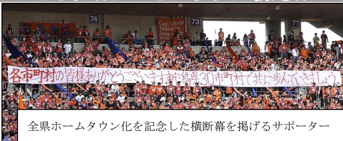
全県ホームタウン化を記念した横断幕を掲げるサポーター

11月24日(日)アルビレックス新潟の最終戦に合わせて全県ホームタウン化を記念したセレモニーがデンカビッグスワンスタジアムで行われました。試合は2-1でVファーレン長崎を下し有終の美を飾りました。