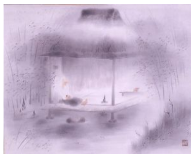
郷倉千靱画「筍を慈しむ」