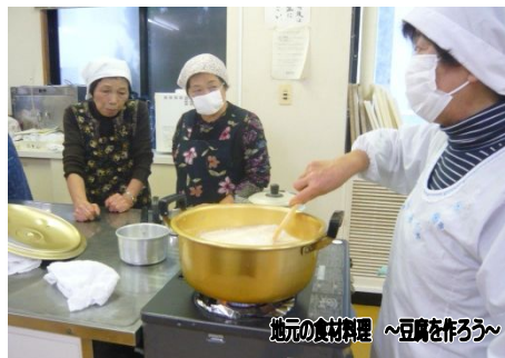
地元の食材料理 ～豆腐を作ろう～