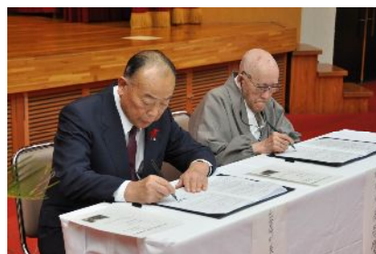
■11/7(水) 良寛記念館事業譲渡調印式 左：出雲崎町長 右：良寛記念館理事長

今回の企画展では、良寛さんの書とともに、良寛さんの敬慕者の作品を併せて展示し、ご来館される方々に良寛さんの生涯を通じた姿を知っていただき、より親しみを深めていただけるよう工夫を凝らしております。ぜひ大勢の皆様のご来場をお待ちしております。