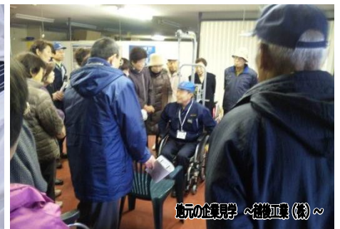
地元の企業見学 ～越後工業(株)～