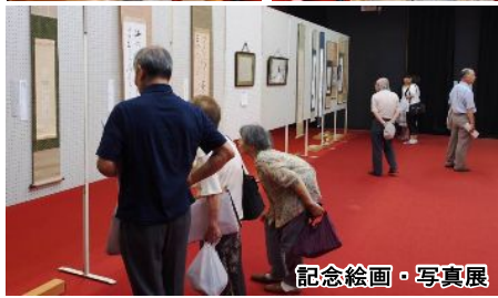
記念絵画・写真展