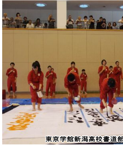
東京学館新潟高校書道部

また良寛堂が建立されて 90 年を迎える 9 月 16 日（日）には、町民体育館にて「良寛堂建立 90 周年記念式典」を開催し、全国良寛会参与の反町タカ子氏と良寛研究家の小島正芳氏のお二方から記念講演をいただきました。また、東京学館新潟高等学校書道部による良寛の詩をテーマとした書道パフォーマンスが行われ、多くの方が観覧に訪れ、90 年の節目を祝いました。