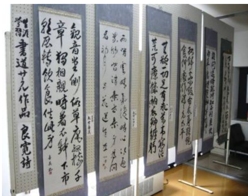
▲「良寛詩」書道サークル