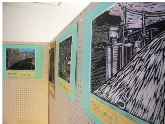
▲「街並版画」出小前6年生卒業作品