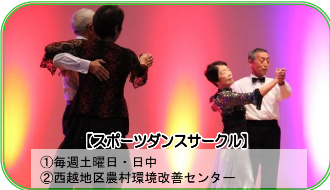
【スポーツダンスサークル】