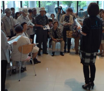
「メディアシップ見学」の様子