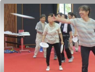
フライングディスクに挑戦

また、現在下記の講座について受講者を募集しています。参加できますので、ご希望の方は中央公民館(Tel 78-2250)へお申込みください。