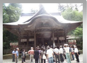
加茂市 青海神社を見学