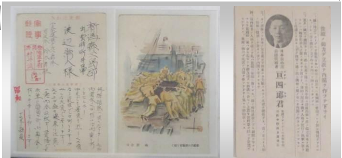
軍事郵便(戦地からの御礼)

今回、その中から、昭和時代の古いハガキを北国街道妻入り会館にて展示しております。皆さまぜひご覧になってください。