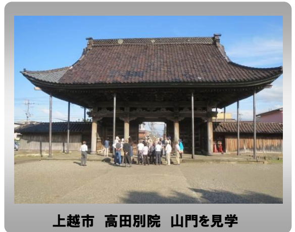
上越市 高田別院 山門を見学