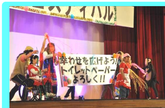
昨年度の ステージ発表の様子

○大人の書道教室 2日(木)・16日(木) ○めばえ教室 3日(金)・31日(金)