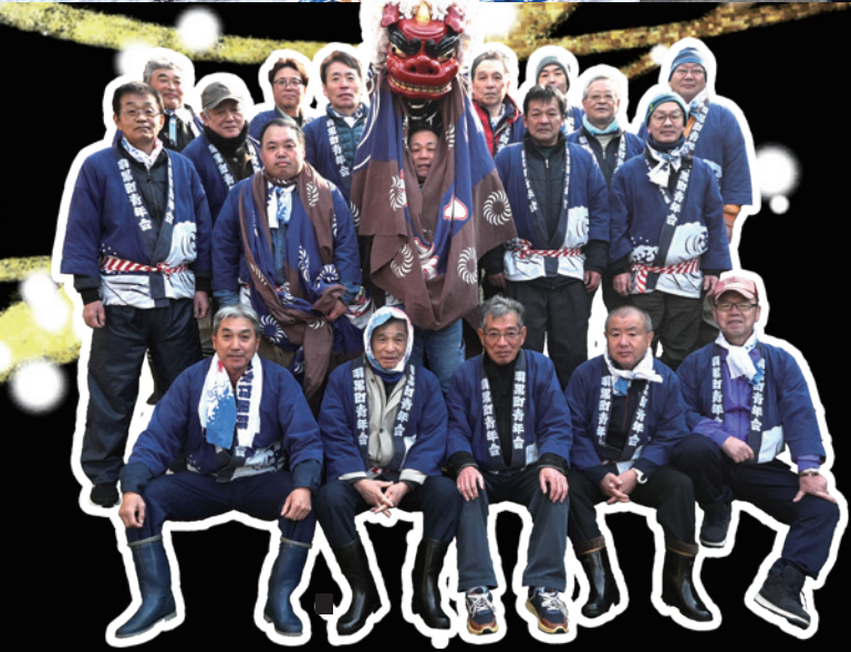
▲羽黒町の獅子舞の集合写真。 皆さんによって町の伝統が支えられています。