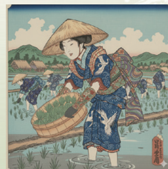
良寛が出遇った盥運びの娘のイメージ像