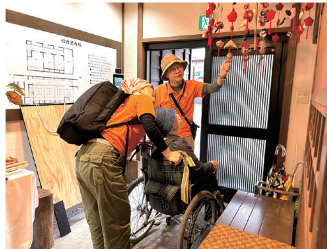
▼車いすの方に合わせた説明を練習していました

11月19日(水)に出雲崎中学校で、町づくり提案発表会が行われました。生徒が出雲崎町の現状を調べ、改善や関係人口の増加に向けてそれぞれ違った観点からのプレゼンをしました。その後、議員から各提案に対する意見、質問、アドバイスが行われ、生徒は町づくりへの理解を深めました。