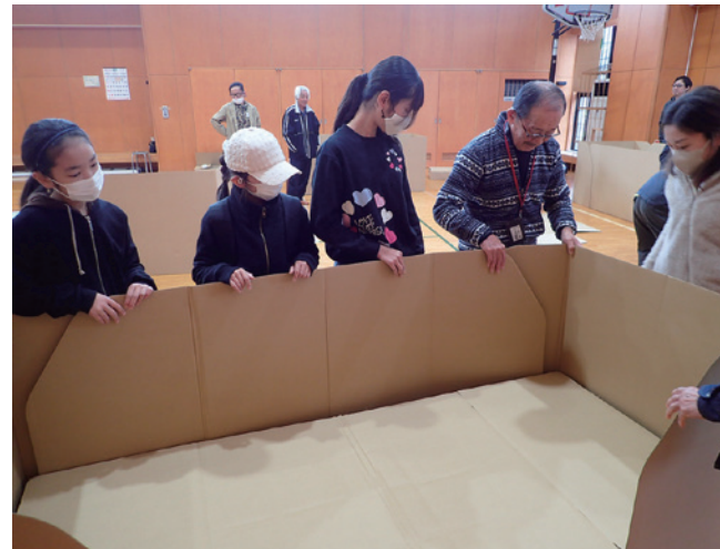
▼協力して段ボールベッドの組み立てをする参加者

10月22日(水)にユニバーサルツーリズム研修が行われました。この研修は、体の不自由な方へどう配慮するかを学び、町の観光を楽しんでもらえる体制づくりを目的に開催されました。観光ボランティアや町家の会、妻入りの会など主に観光に携わる方が参加し、車いすの押し方や、目や耳の不自由な方に対する説明の仕方などを学びました。