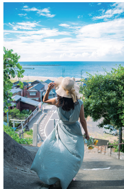
優秀賞・インスタ部門 「海の見える街」

海を背景に楽しく砂浜に落書きする様子がとても微笑ましく出雲崎町の夕景を表現した作品です。