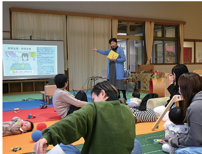
▼参加者は皆さん、講師の手にする絵本に夢中

11月11日(火)に海岸公民館で、婦人会の料理講習会が行われました。13名の会員が参加し、町管理栄養士から指導を受けながら、昆布を使ったアイデア料理を完成させました。【品名】昆布豚肉ロール、結び昆布入りおでん、昆布と野菜のマリネ