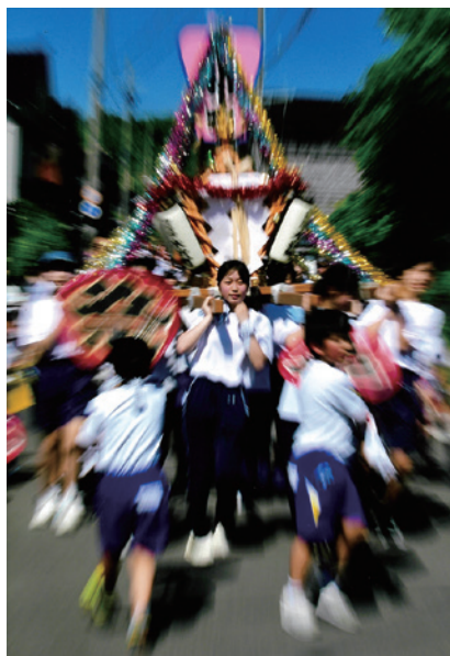
優秀賞・夏 「山車が行く」

満開の桜と夕日にスマホを向けて撮影するスナップ写真、ニット帽の女性が印象的な写真です。