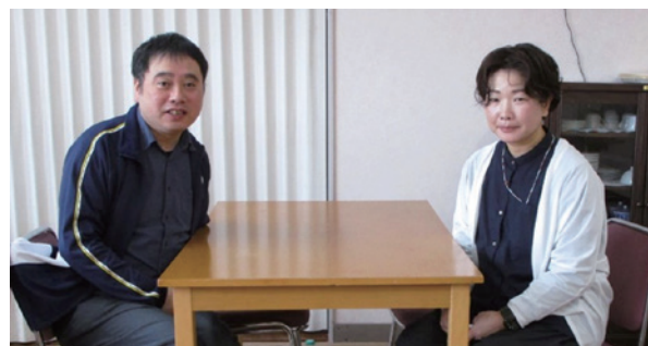
私たちがご相談を承ります