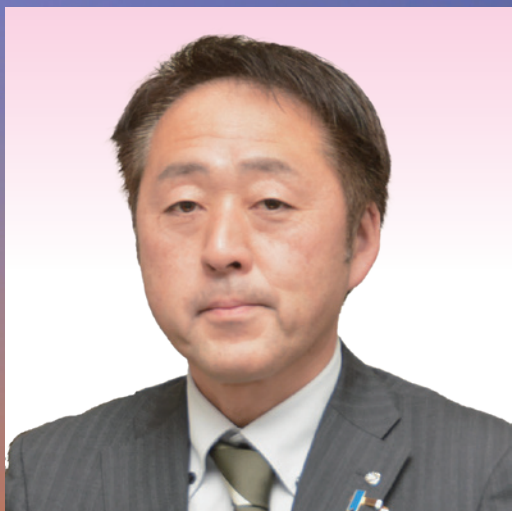
出雲崎町長 仙海 直樹