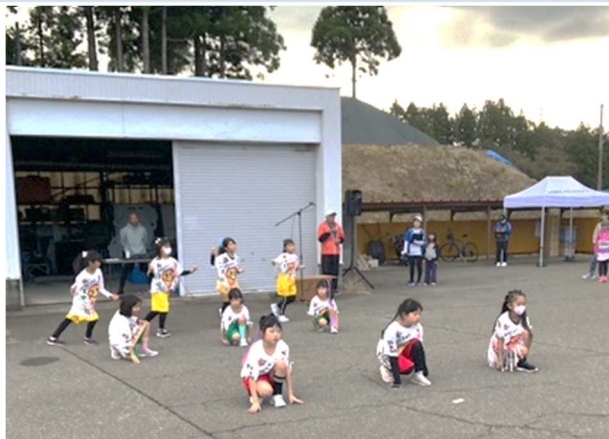
▲出雲崎マラソン オープニングでのダンス

15人の子どもたちが参加し、緊張しながらも、練習の成果を発揮し、堂々と踊りきっている姿が印象的でした。