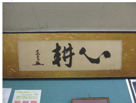
出雲崎小学校の額

「心耕」の精神に基づく「地域の振興は人づくりにあり」の信念は、現在「地域ぐるみで、子育てや教育を支える持続可能なまちづくり」の核となっているように、私は強く感じています。