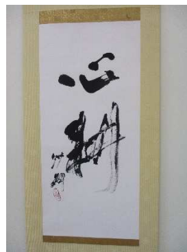
出雲崎高校の掛軸

『昭和9年11月、布川準一郎（井鼻の出身）校長は、下校舎に「心耕学園」の看板を立てた時から、統一校に発展させるという意思を示した。中央校舎の竣工とともに、小学校・高等科・農学校・女学校を統合し、「心耕学園」の名の下に、魂の教育・労作教育に精魂を傾けた。（中略）「心耕学園」で、昭和12年9月に開催された新教育の研究会には、小原国芳玉川学園園長が講師として招かれた。小原国芳学園長は、「心耕学園」を「日本の先生方に、一度は見てもらいたい学校です。」と絶賛した。』