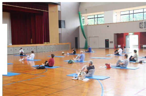
さわやかスポーツ教室