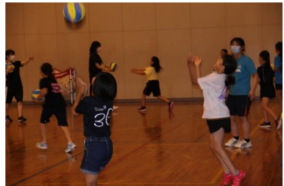
バレーボール教室（小学生）