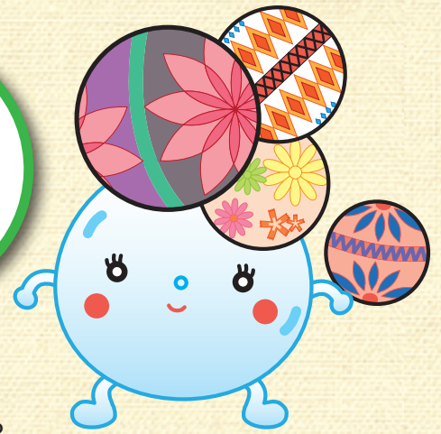
出雲崎町デマンド交通 イメージマスコット 「てまりん」