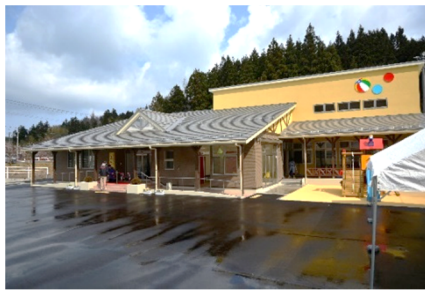
多世代交流館きらり

きらりは入館自由、多目的運動場は町民体育館へお申込みの上でお気軽にご利用ください。お問い合わせはそれぞれこども未来室（☎86-5580）、また町民体育館（☎78-4700）まで。