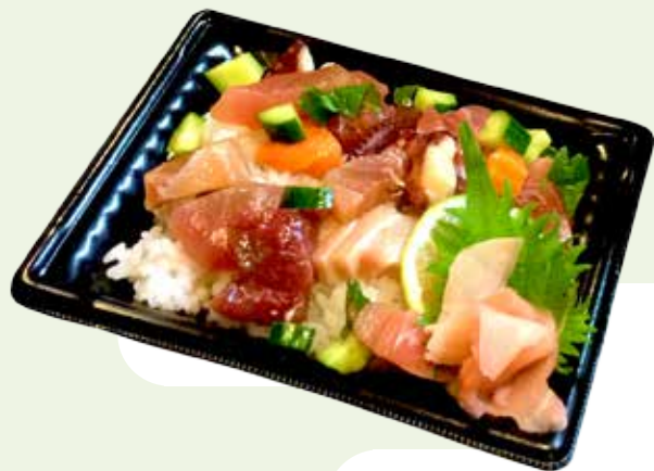
▲▶▶今回は8店舗が参加し、お酒にあう自慢のオリジナル料理を提供しました。