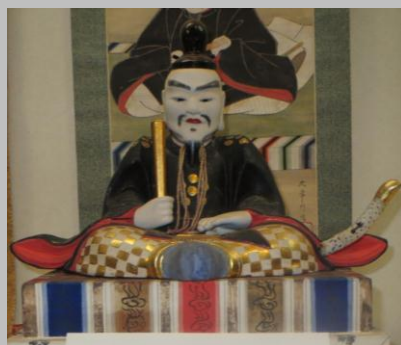
「天神さま」の像 (妻入り会館展示)