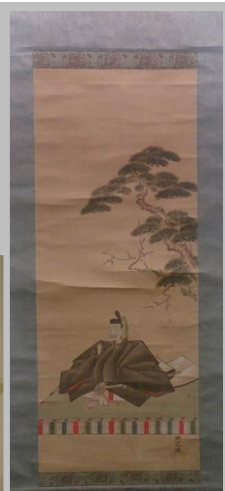
「天神さま」の掛け軸 (良寛記念館展示)