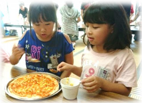
8/23 自然体験とクッキング