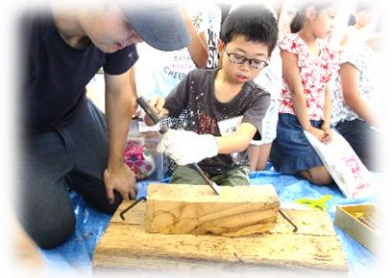
7/28 与板の小学生との交流

今回の5回のプログラム総参加者数は136人と大変多くのお子さんからご参加いただきました。来年はこの企画をよりパワーアップさせていただきますので、今後もご参加をお願いします。