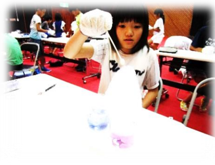
8/22 ドライアイス大実験