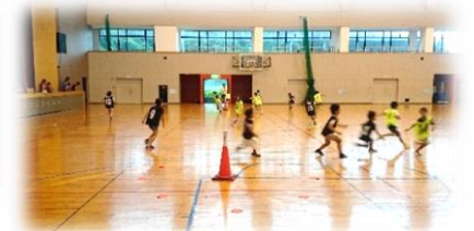
8/18 スポーツ鬼ごっこ