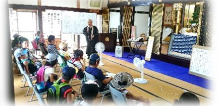
8/17 出雲崎の歴史探検