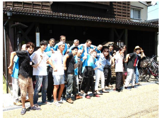
Nポーズをとるみなさん[毒入り会館にて]

また、今年度は新潟テレビ21の取材を受け、「これ！新潟自慢」のCM撮影が行われました。放送日は9月中を予定しているので、ぜひご覧ください。