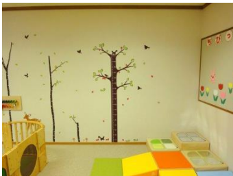
かわいい木のデザイン