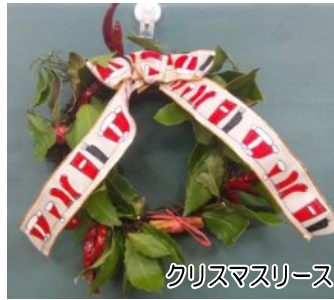
クリスマスリース